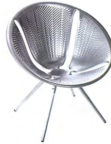
À gauche Fauteuil en aluminium Diatom , design Ross Lovegrove (Moroso).