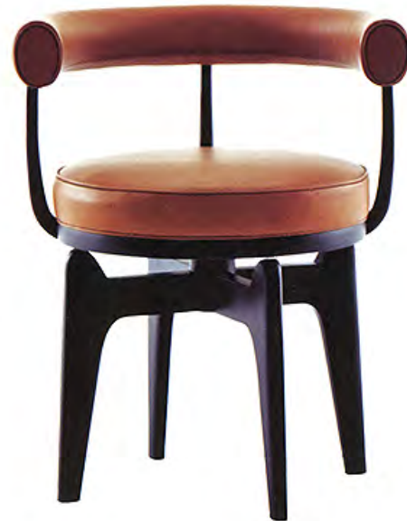
À gauche Table d'appoint Xai de la collection « Salvador Dalí » (BD Barcelona). À droite Réédition de la chaise 528 Indochine de Charlotte Perriand (Cassina).