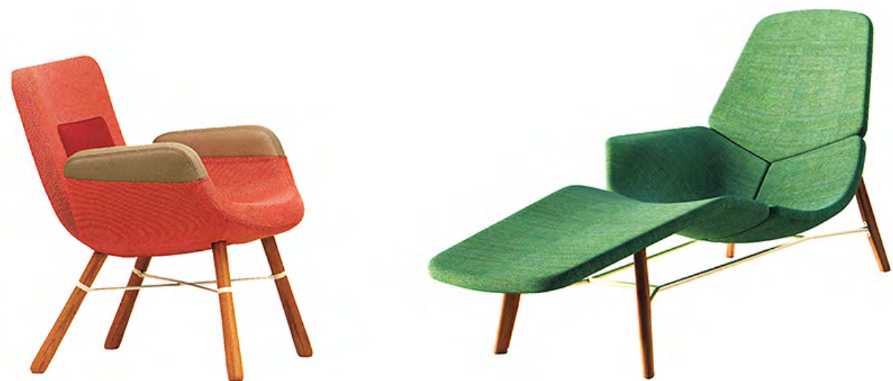
À gauche Fauteuil East River de Hella Jongerius (Vitra). À droite Chaise longue Atoll , design Patrick Norguet (Tacchini).