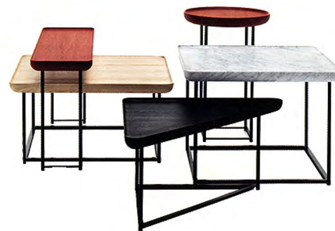
À gauche Tables basses Torei de Luca Nichetto (Cassina). À droite Knoll a montré à Milan une version hyper confortable de la Barcelona de Ludwig Mies van der Rohe.