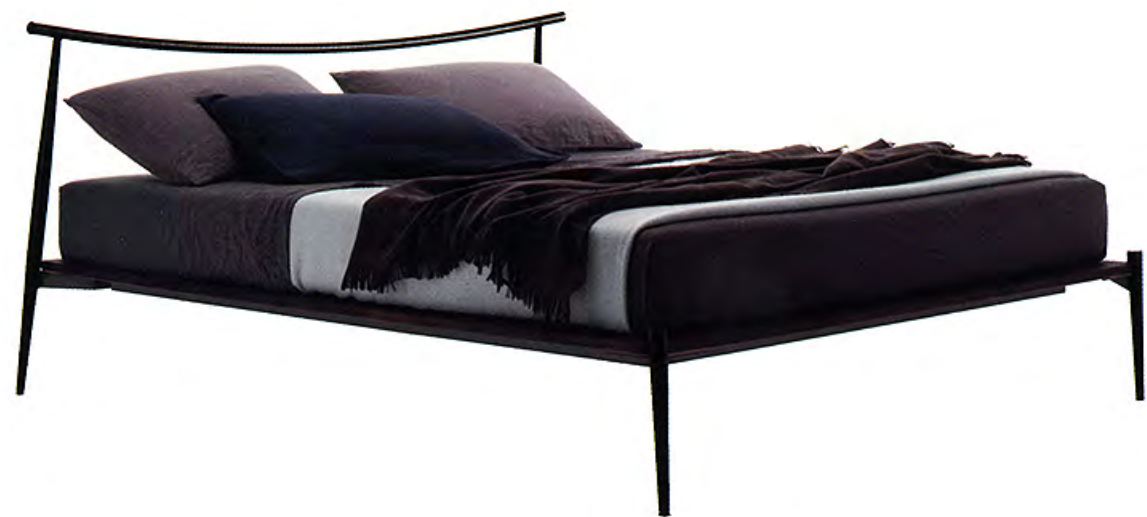
Ci-dessus Lit Orpheo de Ferruccio Laviani (Lema).