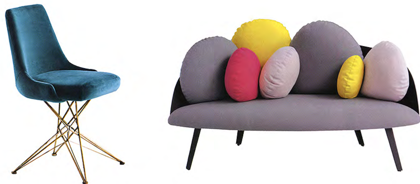
À gauche Chaise Athena de Mauro Lipparini (Arketipo). À droite Canapé Nubilo de Constance Guisset (Petite Friture).