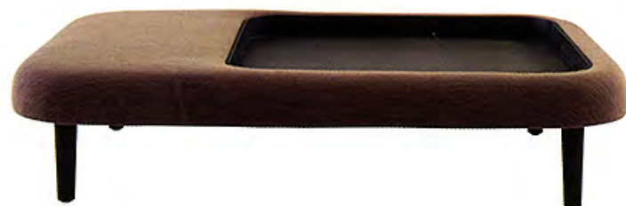
À gauche Fauteuil de la collection « Nivola », design Roberto Lazzeroni (Poltrona Frau). À droite Table basse de la ligne « Fraga » imaginée par GamFratesi pour CInna.