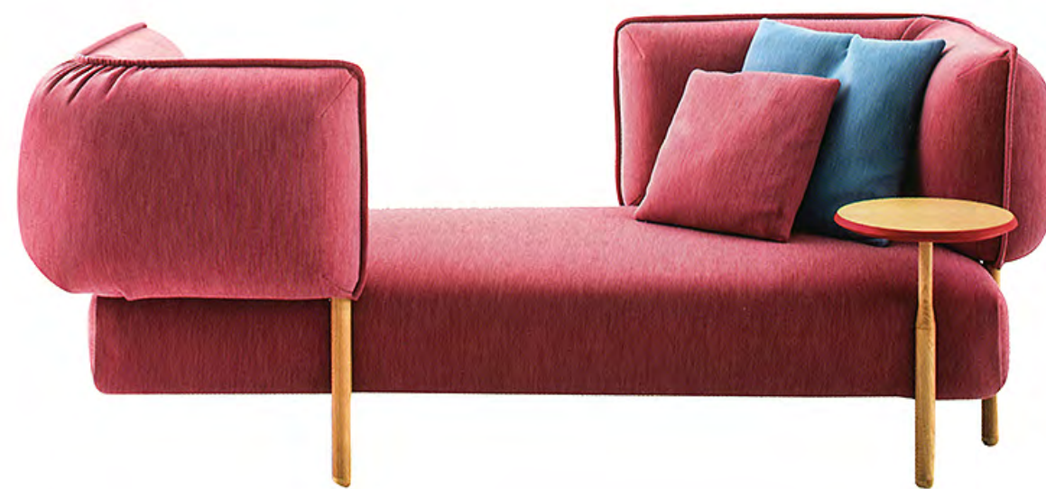
Ci-dessus Canapé modulaire extrait de la collection «(Love Me) Tender» imaginée par Patricia Urquiola pour Moroso.