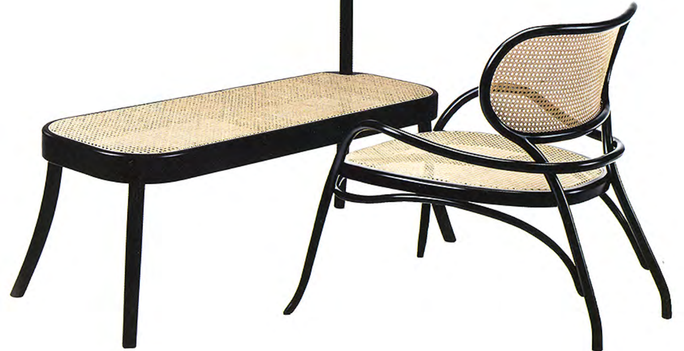
À gauche Banc porte-manteaux imaginé par le trio de Front Design (Gebrüder Thonet Vienna). À droite Fauteuil Lehnstuhl de Nigel Coates (Thonet).