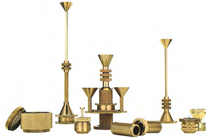
À gauche Fauteuil Almora du duo Doshi-Levien (B&B Italia). À droite Collection d'accessoires « Cog » de Tom Dixon.