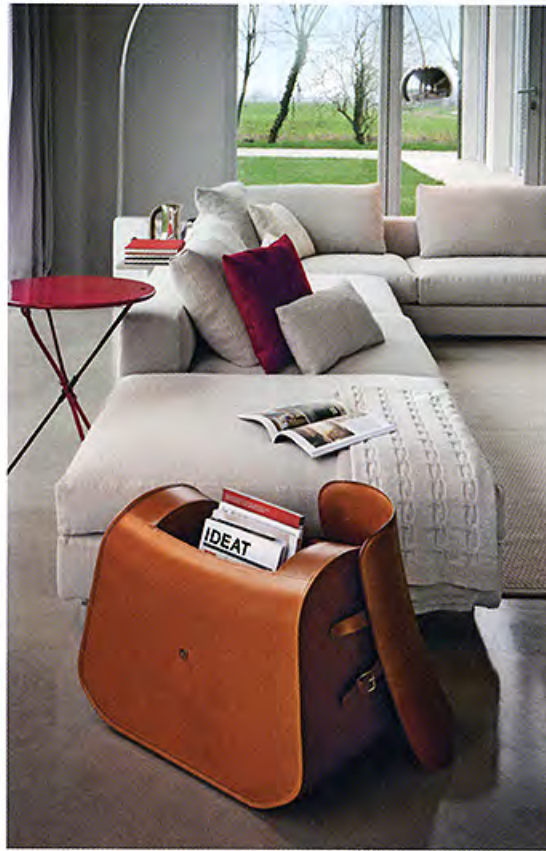
Tabouret-rangement Nuno Stool de Kensaku Oshiro (Zanotta).

L'édition 2014 du Salon du meuble de Milan a dévoilé en avril dernier les nouveautés qui rythmeront la saison du design. Des allées de la Fiera, IDEAT a retenu 22 projets de mobilier entre innovation et rééditions. Une sélection très subjective : normal, ce ne sont que nos coups de cœur !