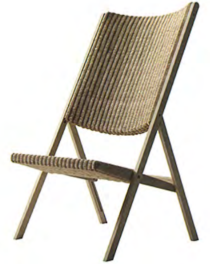
À droite Réédition de la chaise D.270.2 de Gio Ponti (Molteni).