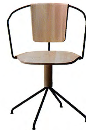
À gauche Table basse G3 de Johan Lindstén (Roche Bobois). À droite Chaise Uncino, design Ronan & Erwan Bouroullec (Mattiuzzi).